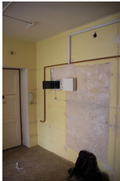
Pojistkové skříň a telefon na chodbě