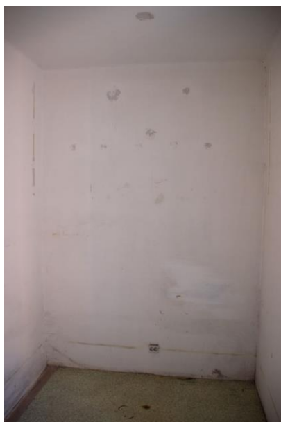
Komora – zadní stěna