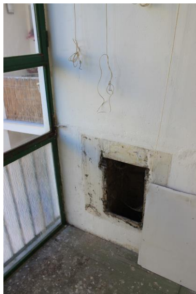
Revizní otvor komínové šachty na balkoně