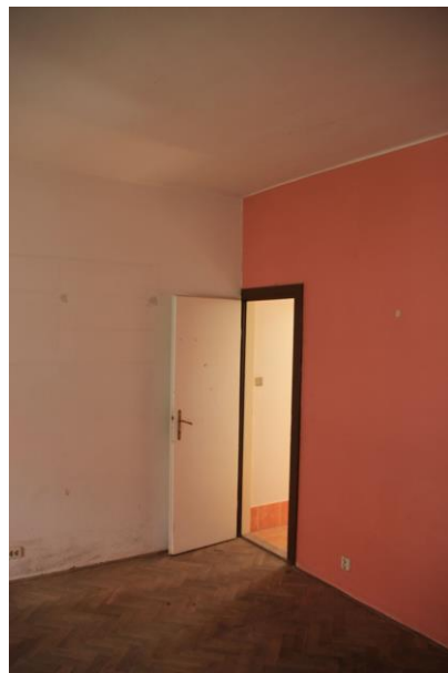
Pokoj – průchod do koupelny