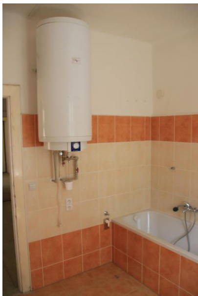
Koupelna – umístění bojleru