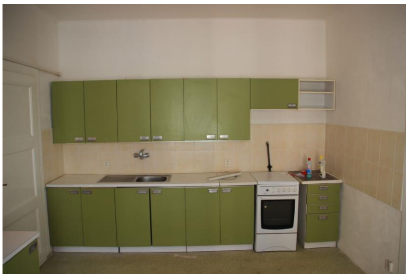
Kuchyně – kuchyňská linka