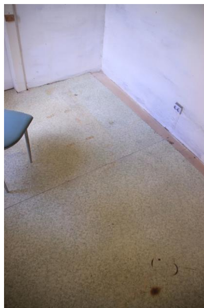
Komora – detail podlahy