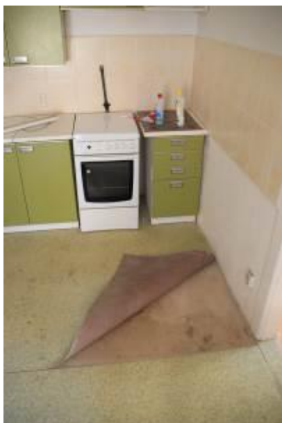
Kuchyně – detail podlahy