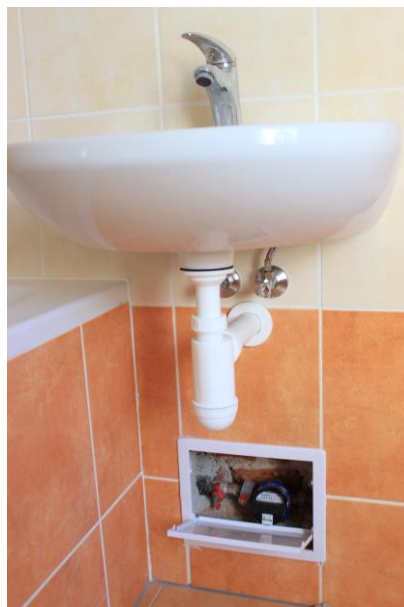
Koupelna – umístění vodoměru