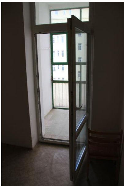
Vstup na balkon ze vstupní chodby