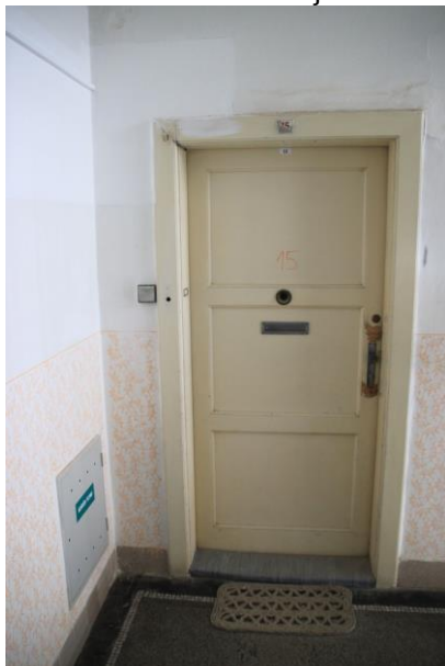
Hlavní vstupní dveře