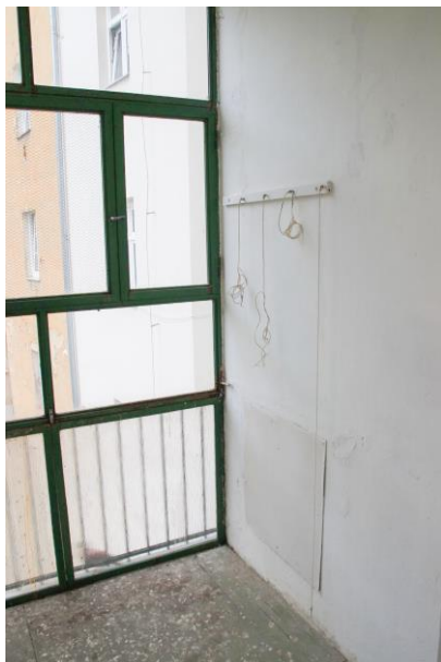
Okenní výplň balkonu