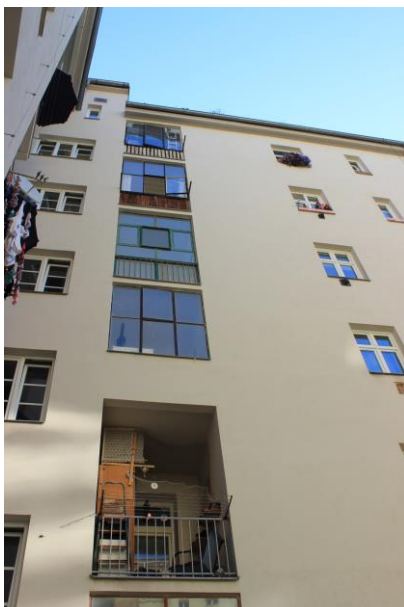
Pohled na okenní výplň balkónu ze dvora